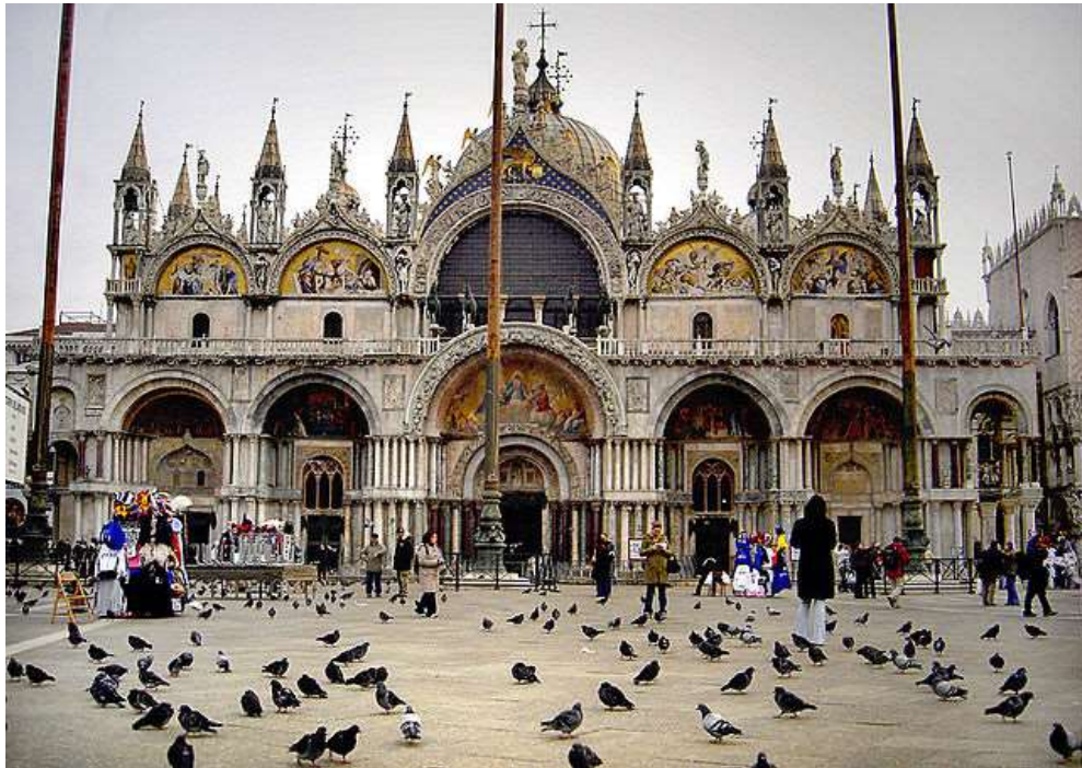
Portentosa Basílica de San Marcos en Venecia, Italia

—No fueron allá volando, porque como verás no tienen alas. Simplemente, los venecianos, en esos días cuando todavía no existía la República de Italia y ellos formaban un mini estado muy poderoso económica y militarmente como Hong Kong, Brunei, Singapur. . . Los venecianos se los robaron y se los llevaron de Estambul a Venecia. Así de simple. Esos caballos nada tienen que ver con mi chochera Marcos. Pero esto nadie lo sabe; sólo yo, tú y el Papa Pancho. ¿Ya?