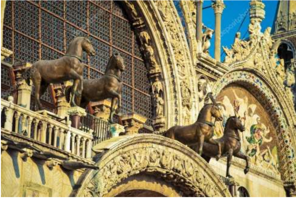
Los Cuatro Caballos del frontis de la Basílica de San Marcos en Venecia, Italia