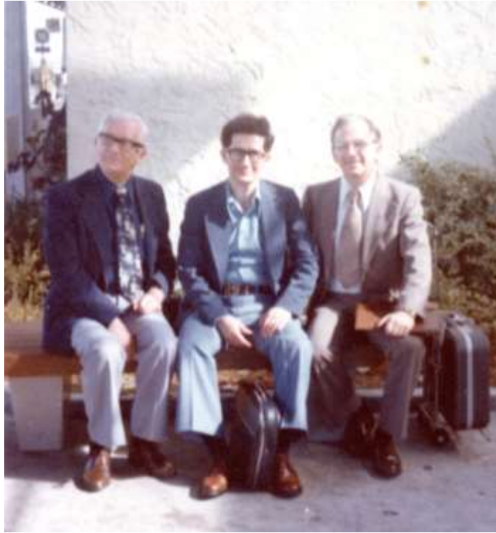
LOS EDITORES DE LA BIBLIA RVA

No es nuestro propósito entrar en detalles sobre la Biblia Reina-Valera Actualizada (RVA), porque a ella dedicamos un libro completo con el título de, Su Majestad, ¡la Reina de España! , que es el Volumen N° 3 de la Serie ACONTECIMIENTOS MEDIATICOS de la página web Biblioteca Inteligente. Asimismo tratamos ampliamente de ella el Volumen 11 de la Serie CIENCIAS BIBLICAS 11 que lleva por título, La ciencia de la traducción bíblica .