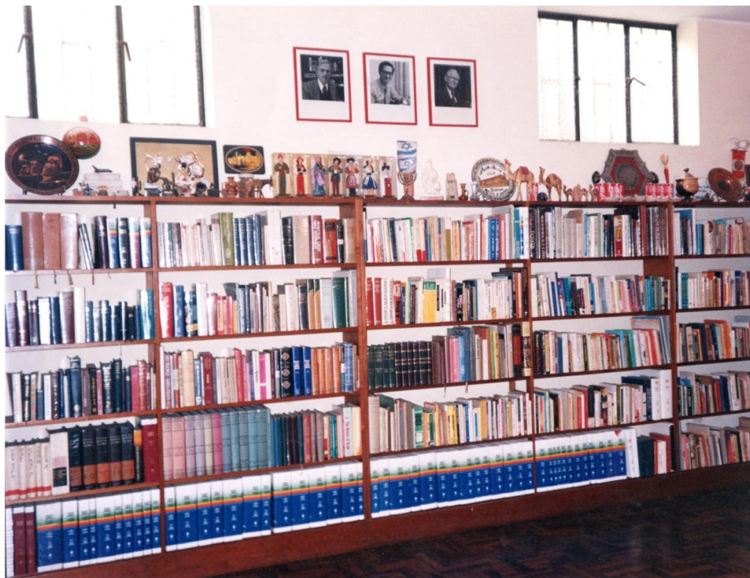
VISTA PARCIAL DE LA BIBLIOTECA INTELIGENTE Y DEL MUSEO DE LA BIBLIA DEL CEBGAR Al pie, empastados en color azul, están los originales de la Biblia RVA y de la Biblia Decodificada .